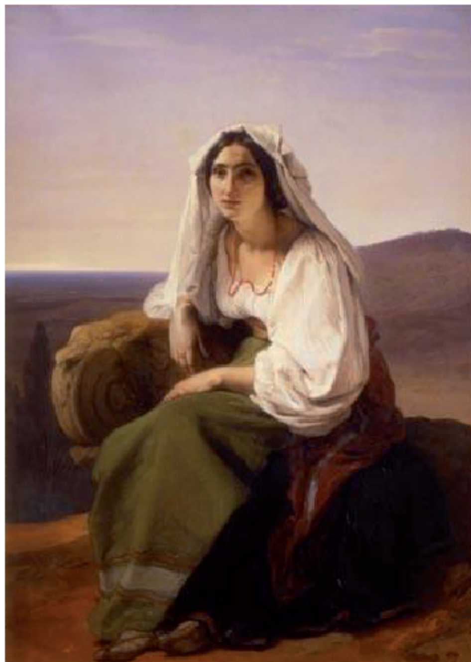
F. Hayez, La Comare, 1843