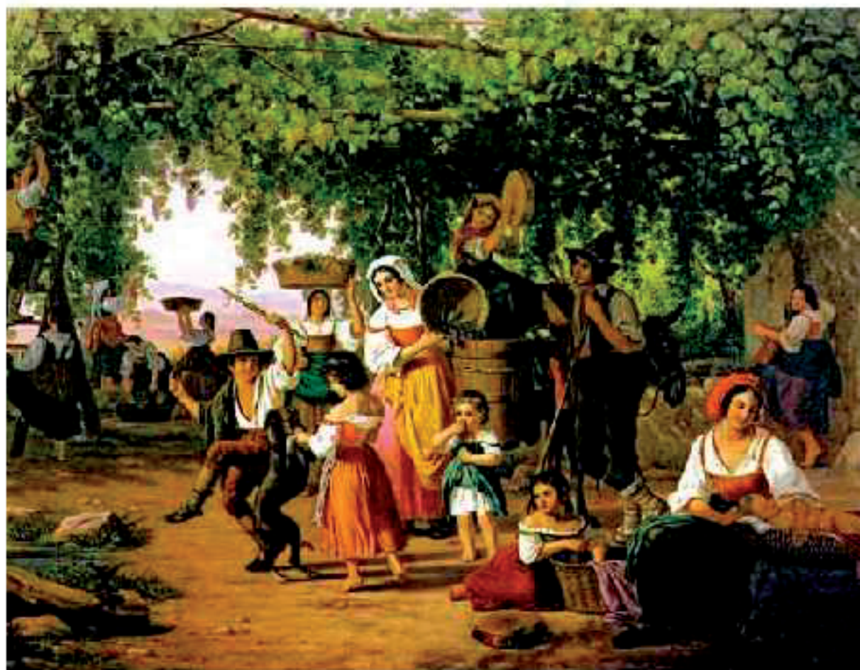
La vendemmia. Dipinto di Peter Paul Rubens (1644)