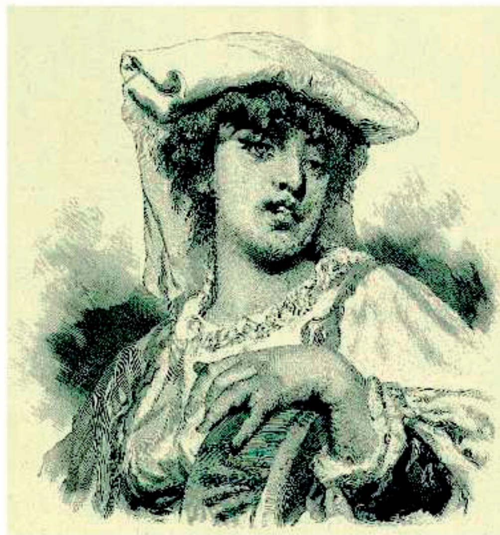
La Crociata. Incisione di H. Centenari di un dipinto di H. Jona (1892)